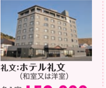
礼文：ホテル礼文 (和室又は洋室)

4名1室 159,000 円 3名1室 162,000 円 2名1室 165,000 円