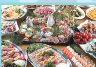
休暇村大久野島 夕食ビュッフェイメージ