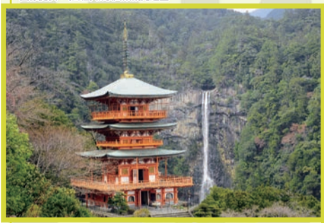
青岸渡寺と那智の滝